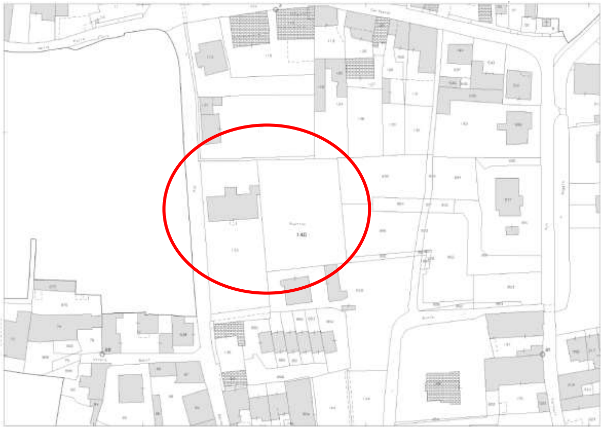
Estratto di mappa del Foglio 16 – Mappali 133 sub.1 e 140