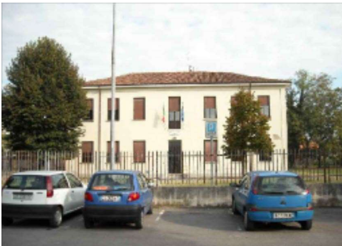
Vista dell'immobile da Via Garibaldi