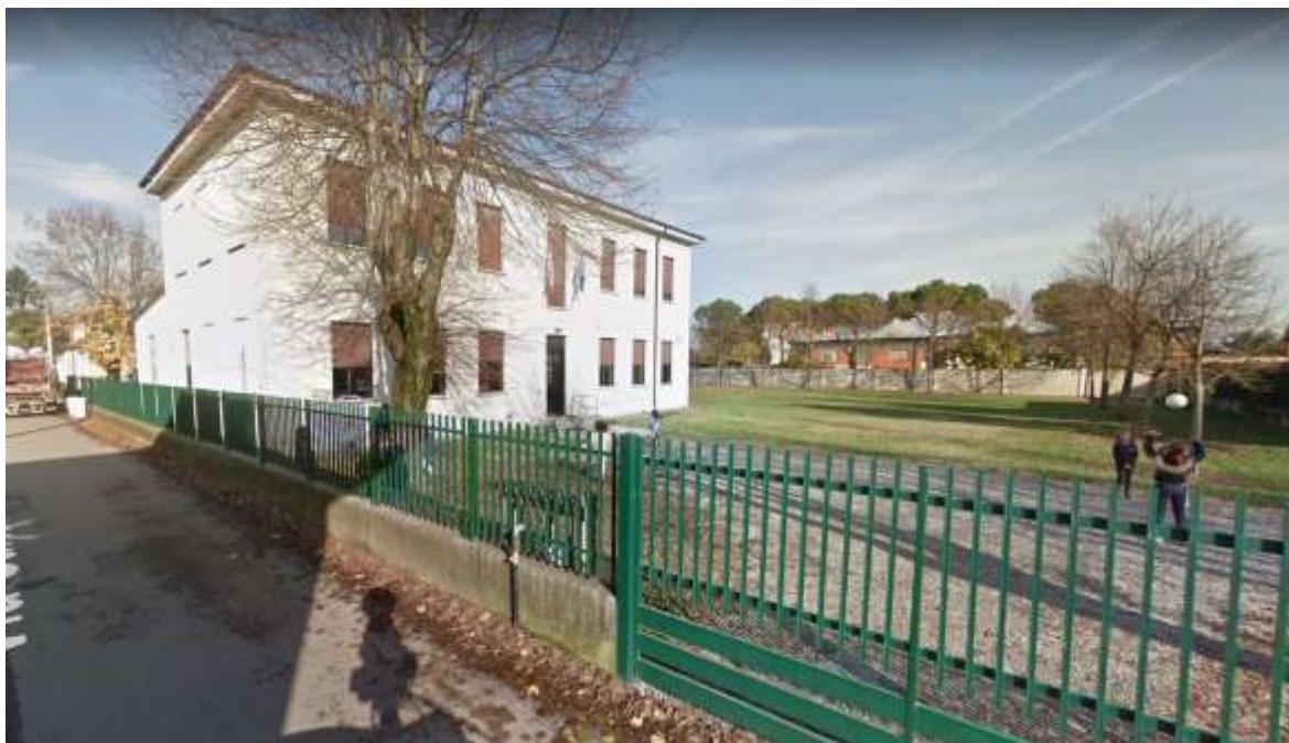
Vista dell'immobile da Via Garibaldi