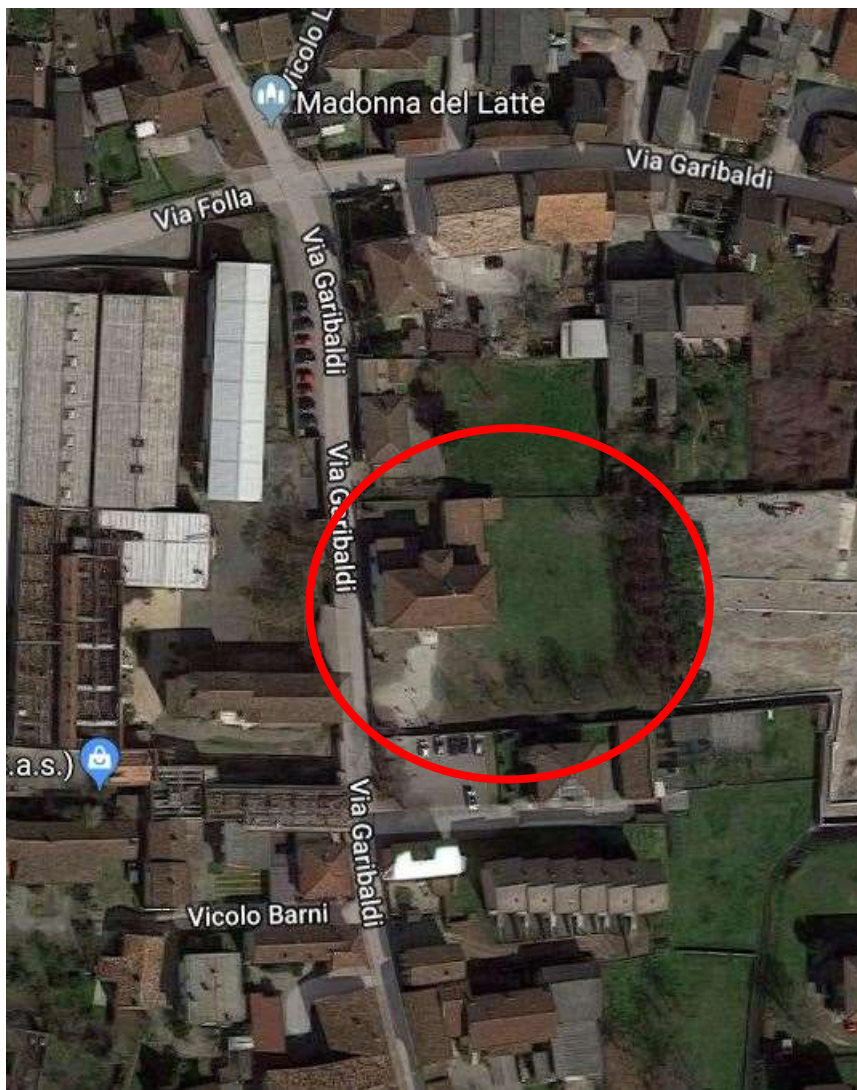
Vista aerea dell'immobile